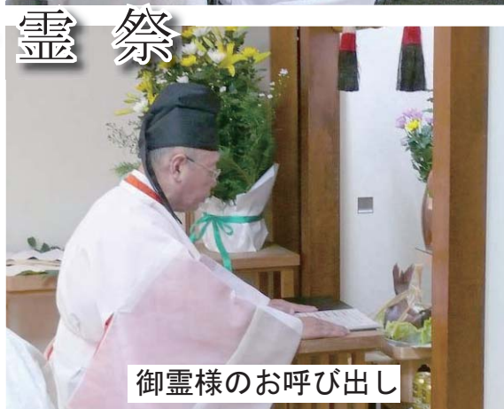
御霊様のお呼び出し