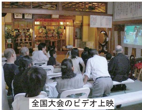
全国大会のビデオ上映