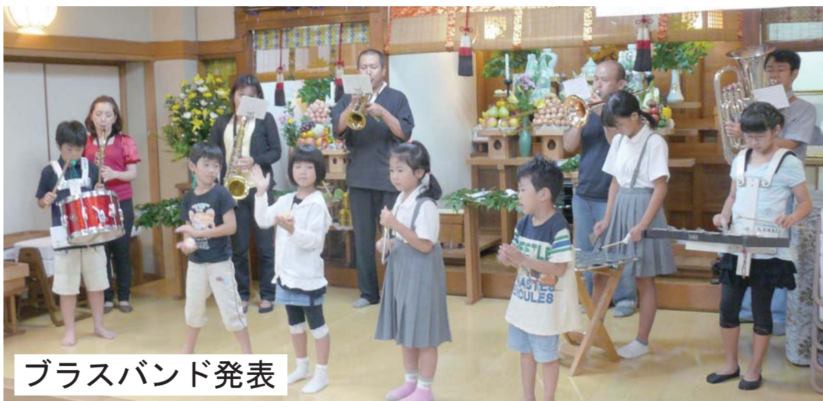
ブラスバンド発表