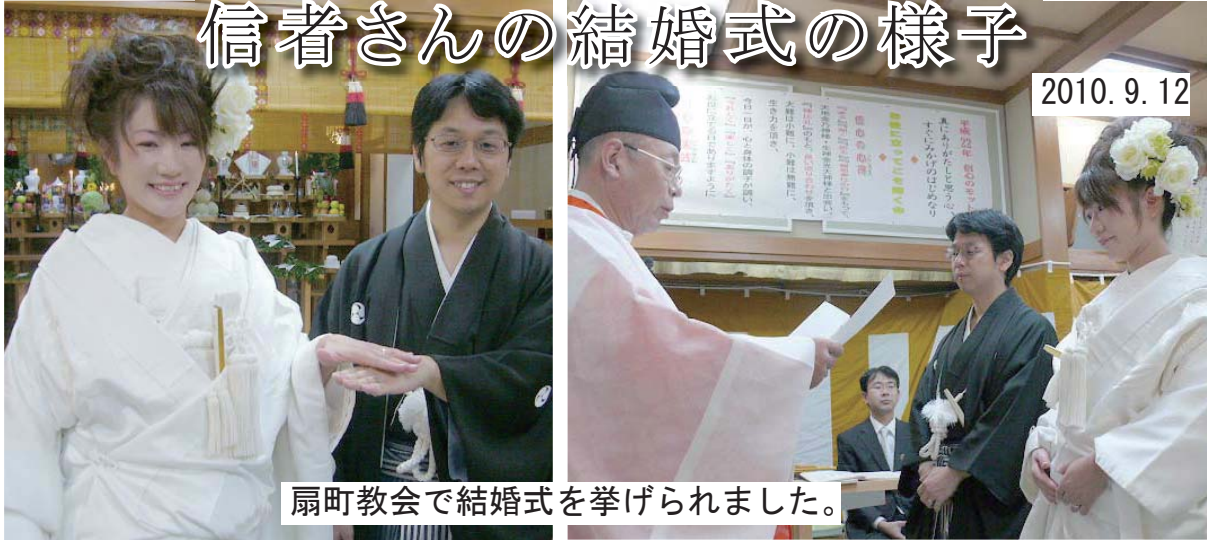
扇町教会で結婚式を挙げられました。