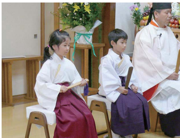
お祭り前まで雨が降り、お供え物は出来ませんでした。が、御祈念時には雨も上がりおかげを頂きました。