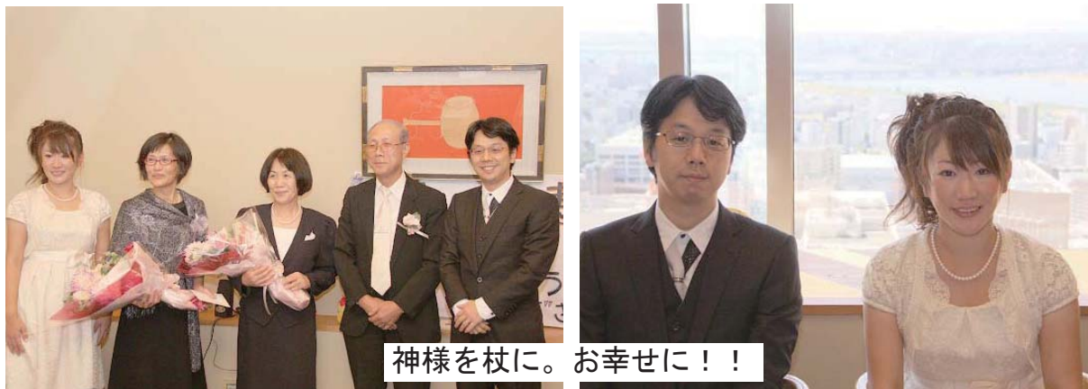
神様を杖に。お幸せに！！