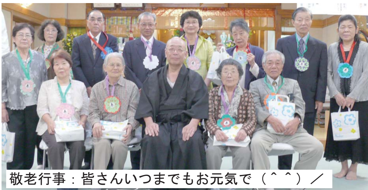
敬老行事：皆さんいつまでもお元気で（^^）／